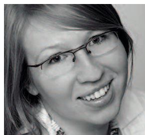
ARCH. MAŁGORZATA BREWCZYŃSKA INVENTIVE INTERIORS

Głównym elementem tej łazienki projektant uczynił ścianę główną, która w całości pokryta jest lustrami pociętymi w prostokątne tafle. Dzięki temu niezbyt szerokie pomieszczenie stało się bardziej przestronne. Efekt ten utrwała również fornir teakowy, który prócz harmonijnej zabudowy pralni i stelaża podtynkowego w.c., pojawił się jedynie na wąskim paśmie akcentującym umywalkę. Autor projektu: arch. Piotr Gierałtowski, Gierałtowski i Partnerzy.